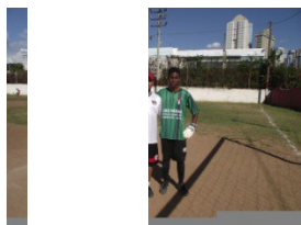
Tales – Categoria 1998 (14 anos) – Cruzeiro em 2011